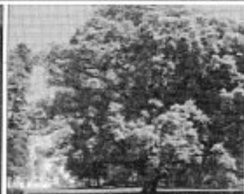
Un dels idíl·lics racons dels jardins; a baix, Inés Padrosa i Jaume Barrachina mostrant un dels plànols originals dels jardins i, a la dreta, l'alzina de 300 anys amb el castell al fons ■ x.c.

dins s'obren al públic, amb una experiència pilot de visites guiades que començaran l'1 de juny; cada dia, de dimarts a dissabte, hi haurà visites a les 11 del matí i a 2/4 de 6 de la tarda –a les 11 i a les 7 al juliol i l'agost–, i a partir del novembre s'ofriran visites concertades per a grups, una opció també disponible la resta de l'any.